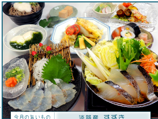
今月の旨いもの 淡路産 すずき