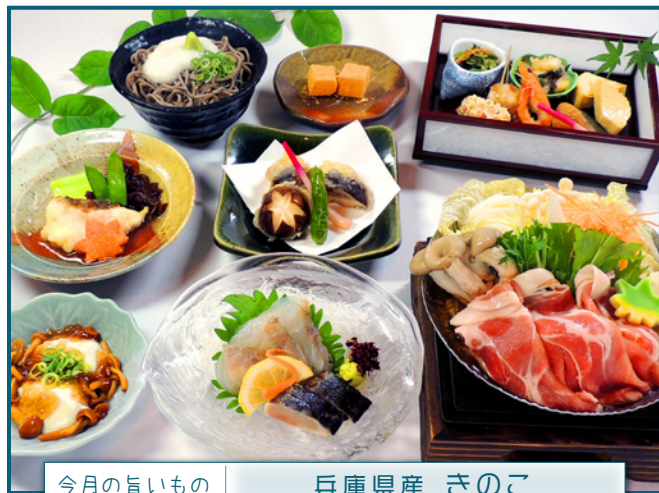
今月の旨いもの 兵庫県産 きのこ

今月は兵庫県の自然豊かな土地で栽培された、きのこをふんだんに使ったお献立をご用意いたしました。かきのき茸や、平茸、やなぎまつたけなどちょっとめずらしいきのこもお楽しみいただけます。かぐわしい秋の香りにもこの時季だけの美味を千人代官でご堪能下さい♪